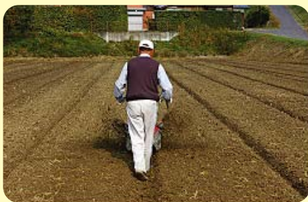
播種後の溝付け作業

一輪管理機などを使い排水溝を設置します。設置にあたり溝と溝の接続、落とし口と確実に連結し、スムーズな排水に努めましょう。