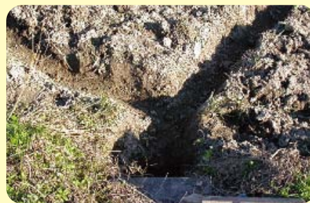
落とし口と確実に連結を

具体的な技術内容は、「小麦・はだか麦の栽培しおり」(J A 香川県発行)をご覧ください。