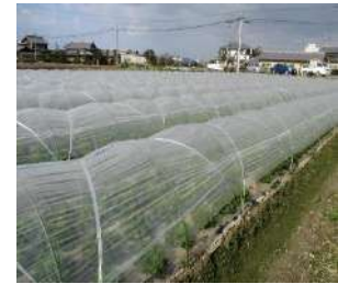
例：耐久性資材 (トンネル資材)