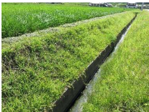
カバープランツ（ムカデ芝）

整備済の農地・農道・水路やため池の法面にカバープランツ（地表を覆うように育つ植物）や防草シート等の施工、急傾斜や広い法面などに管理用小段の設置