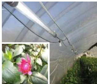
例：LED とガリア新品種の導入