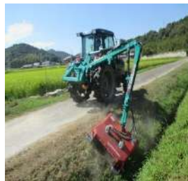
例：農業用設備 (トラクター用 アーム式草刈機)

認定農業者、新規就農者（認定新規就農者又は人・農地プランに位置付けられた就農5年以内の中心経営体）及び認定農業者となることが確実と認められる集落営農法人等