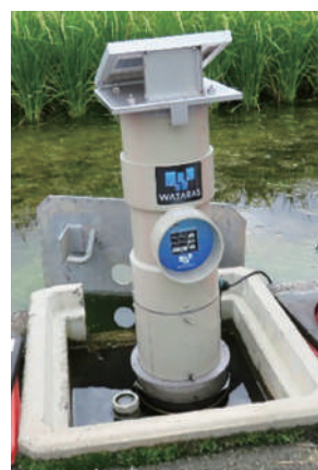
多機能型自動給水栓

パイプライン実施済地区における多機能型自動給水栓の設置やポンプ施設の除塵機設置 等