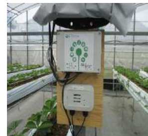
例：イナハスへのクラウドシステムによる施設内管理